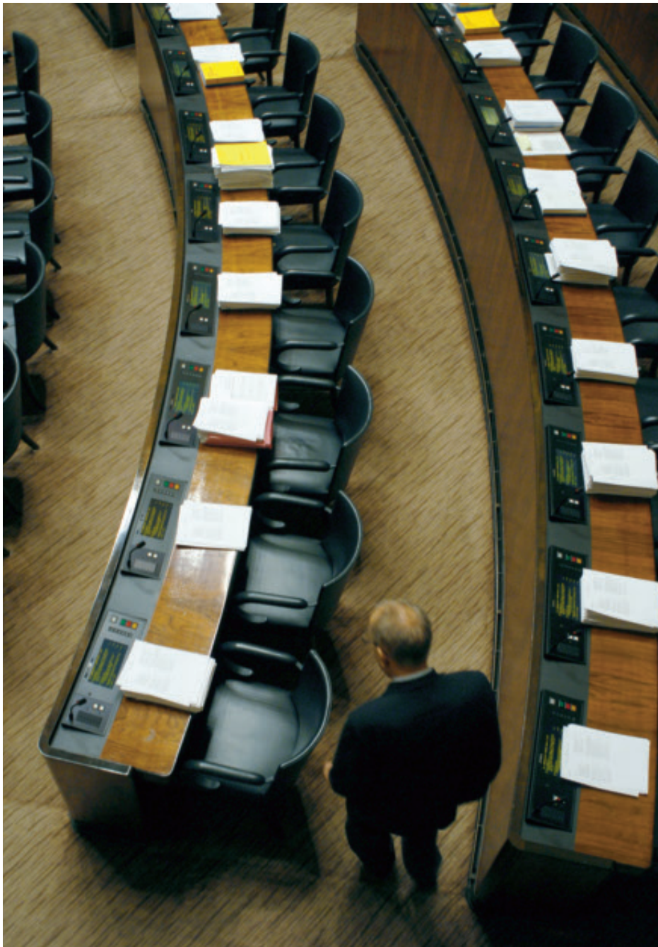
■ Vain yksi puhe. ”Itse nousem pönttöön vain kerran, puhuakseni Venäjistä.”

lä huonetta. Minulle kerrotaan, että jäsenten kielitaito on jonkin verran parantunut. Muistan omalta kaudelta varapuheenjohtajana (ja joskus ulkomaanmatkojen pomona), että ummikointa oli yllättävän monta. Nytemmin kaikki osaavat edes ymmärrettävästi englantia.