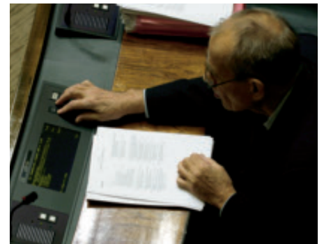
■ Päätöksiä napinpainalluksella. ”Elämässä on haus Kempaakin tekemistä. Vai onko?”

Samalla yritin (ja yritän edelleenkin) ▶