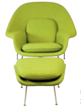
■ Womb-tuoli, 1947-48.

jon rikkaampaa ja suurempaa kuin mitä nykyisin näemme”, Saarinen lausui.