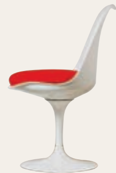
■ Tulip-tuoli, 1956.

Viimeistään nyt Eero Saarinen tunnettiin Amerikassa muuallakin kuin ammattipiireissä. Amerikkalaiset rakastivat menestystarinoita, ja tässä oli täydet ainekset: kuuluisan isän menestyvä poika. ▶